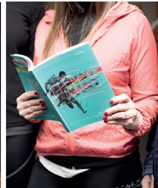
Innan träningspasset blir det högläsning ur Pulsboken , en andaktsbok för idrottsgrupper.