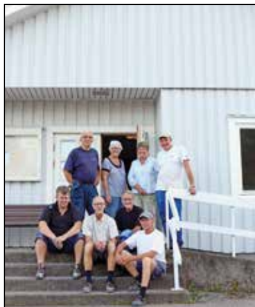
Ett arbetsgång samlade utanför Önneredsgården.

Nu kan vi se resultatet. En del smärre ombyggnader har skett, men framför allt har alla lokaler fått en rejäl uppfräschning. Under våren och